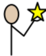
Viktiga nära personer