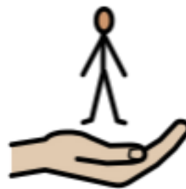
Stöd från andra (t.ex. Socialtjänst, BUP)